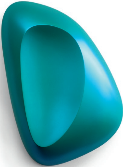
Scoop.turquoise - 2018 88 x 65 x 13 cm