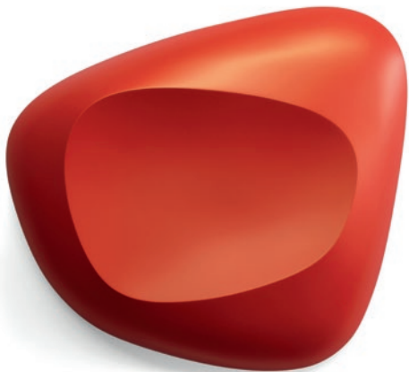
Scoop.red - 2018 31 x 35 x 5 cm