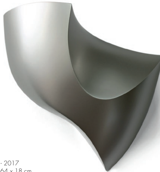
Brute - 2017 61 x 64 x 18 cm

Foto auf der Titelseite / Photo on front page: Cane - 2019 122 x 42 x 18 cm